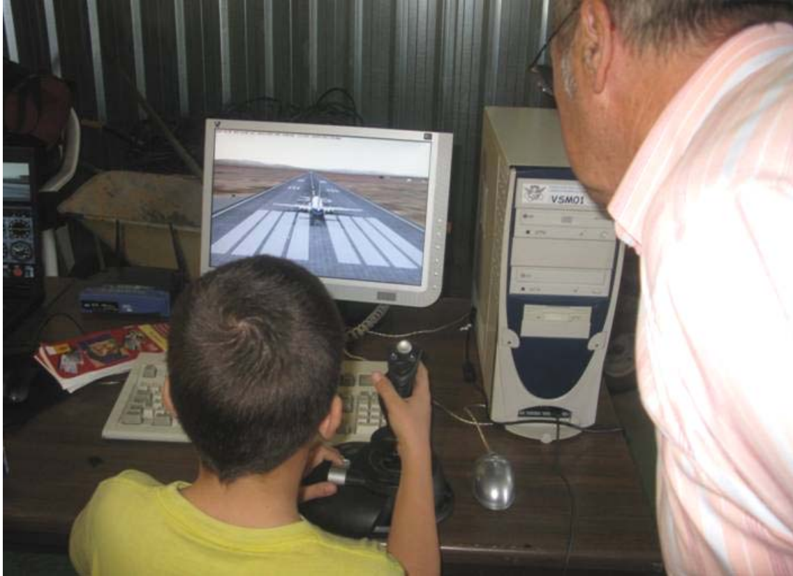
Jornadas de puertas abiertas

Estas jornadas se realizan conjuntamente con el Campeonato de Andalucía por entender que el número de participantes no refleja la actividad real de esta especialidad deportiva, pretendiendo con ello la promoción del Vuelo simulado entre las personas interesadas, con la idea de que en un futuro próximo puedan ingresarse en las actividades que se celebren.