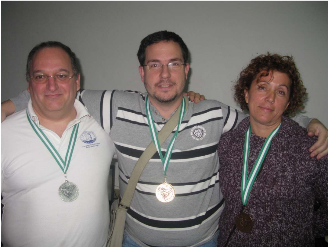
2º, 1º y 3º Clasificados

Es importante indicar que la experiencia demostrada por el Jefe de Jueces y el Director de Organización, ayudó a que el campeonato se realizara sin ningún tipo de reclamación.