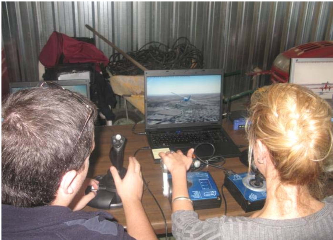
Jornadas de puertas abiertas