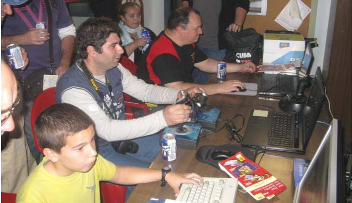
Jornadas de puertas abiertas