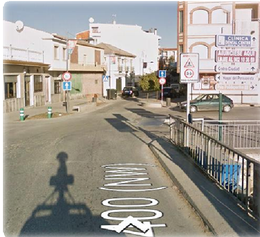
Entrada Huétor Tájar; continuamos todo recto