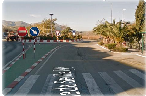
Segunda rotonda; primera salida