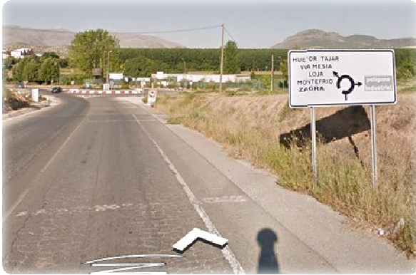
Primera rotonda; segunda salida